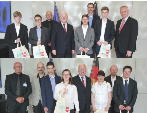
Beste Landtag-Online-Redaktion 2015/2016! Online-Redaktion des Gymnasium Brake bei der Preisverleihung durch Landtagspräsident Bernd Busemann im Juni 2016.